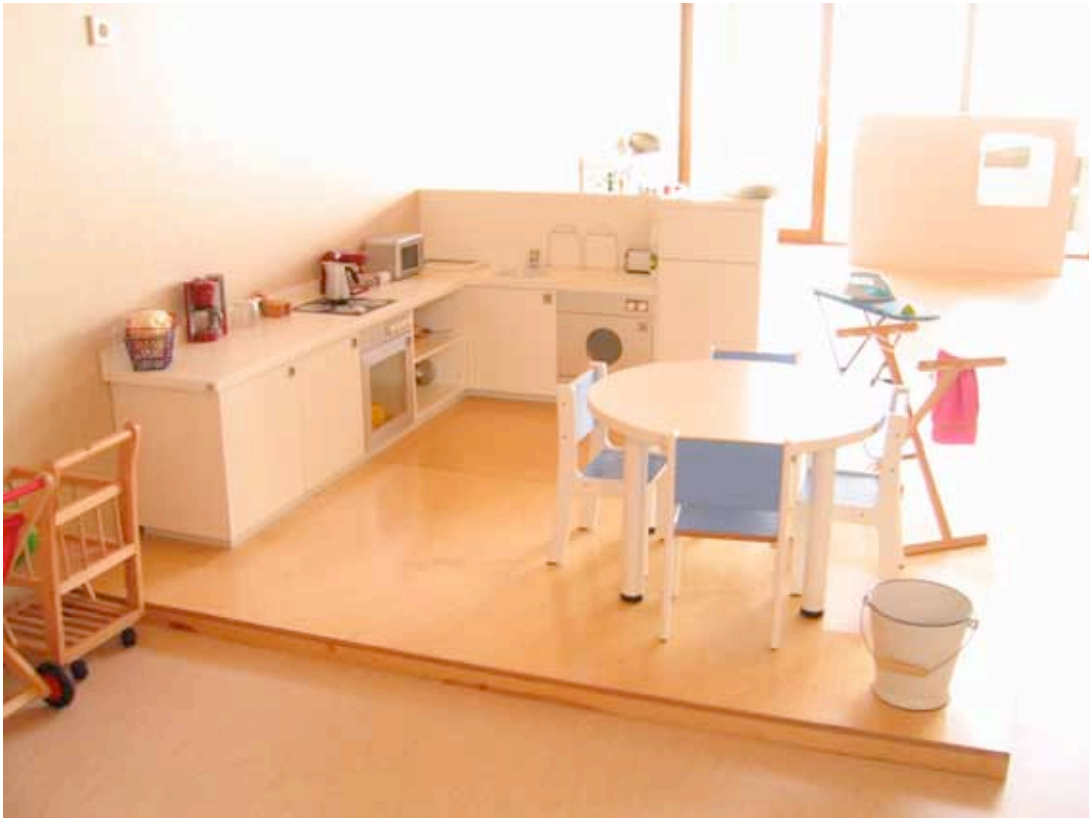
SALA DE LACTANCIA