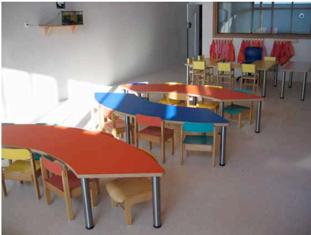
SALA DE USOS MÚLTIPLES